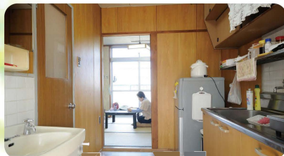
明るい間取りの居室